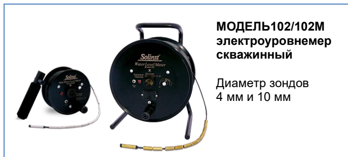
МОДЕЛЬ 102/102М электроуровнемер скважинный

Конструкция излучателей Waterloo предусматривает измерение уровня, отбор проб и другие манипуляции на оснащенных скважинах. Работа в узких диаметрах требует специального инструмента. Solinst предлагает несколько вариантов оборудования.