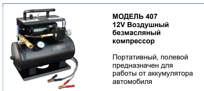
МОДЕЛЬ 407 12V Воздушный безмасляный компрессор

Гибкий тефлоновый насос Ø10 мм. Работает с глубины до 90 метров