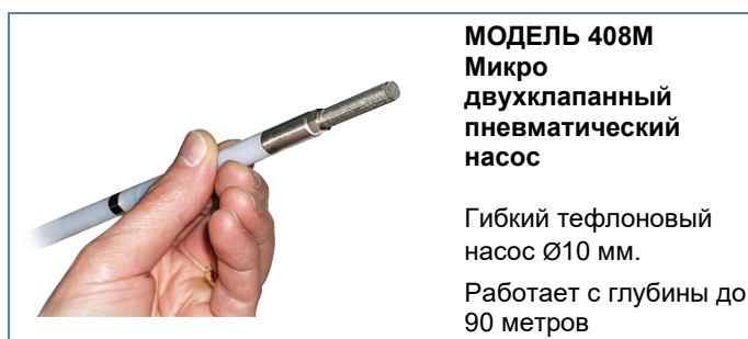
МОДЕЛЬ 408М Микро двухклапанный пневматический насос

Гибкий тефлоновый насос Ø10 мм. Работает с глубины до 90 метров