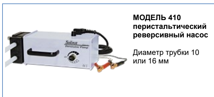
МОДЕЛЬ 410 перистальтический реверсивный насос