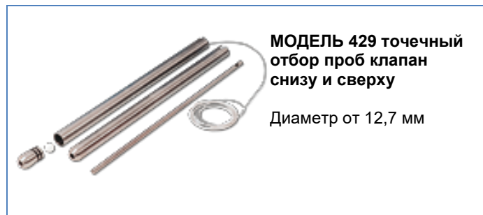
МОДЕЛЬ 429 точечный отбор проб клапан снизу и сверху